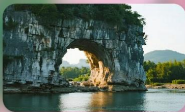
เหวงวงซ้าง