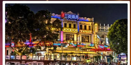
ถนนสามชอยสองตรอก