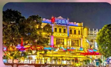
ถนนสามชอยสองตรอก