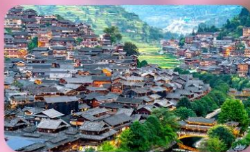
หมู่บ้านแม้วซีเจียง