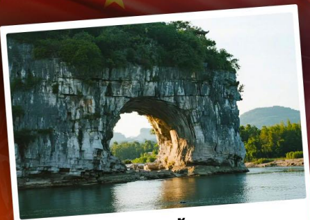
เขาวงช้าง

เที่ยวชมอุทยานซากุระหมีน้ำ "เขื่อนดินแดนแห่งขุนเขาและสายน้ำ หยางชิว"